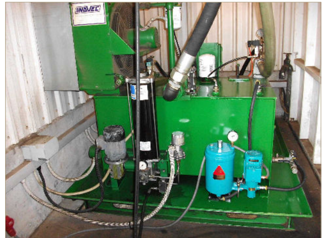
CJC® Ölpflegesystem 15/25 installiert an dem Hydraulikaggregat der Blockbandsäge

Bei einer Verbesserung der Ölrreinheit von ISO 18/16/12 auf 16/14/11 ist zu erwarten, dass sich die Lebensdauer von Öl und Komponenten um ca. 50 % erhöht (Quelle: Noria Corp., www.noria.com).